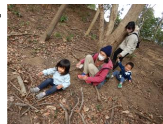
小さい子 もママに 抱かれて 森林浴。