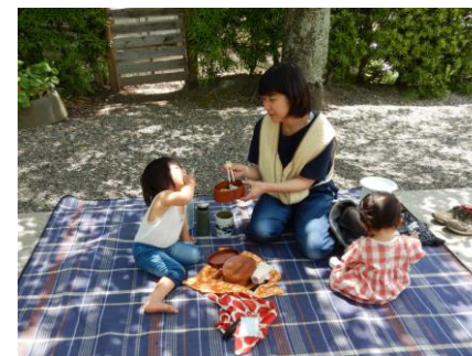
今日はここで食べよう！お庭や参道に シートを広げてお弁当タイム。