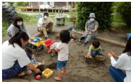
砂場で、じっくりおままごと、工事ごっこ。