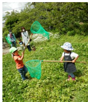
お山の斜面を登っ たり降りたりが 楽しい森の劇場。