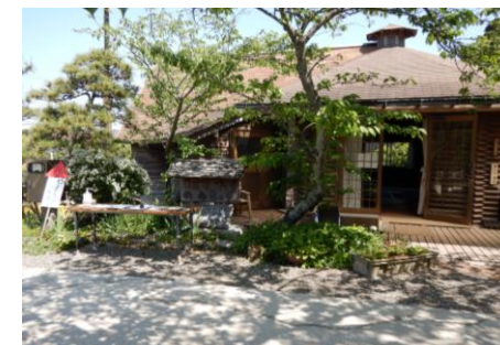
受付は建物の前にあります(晴天時)